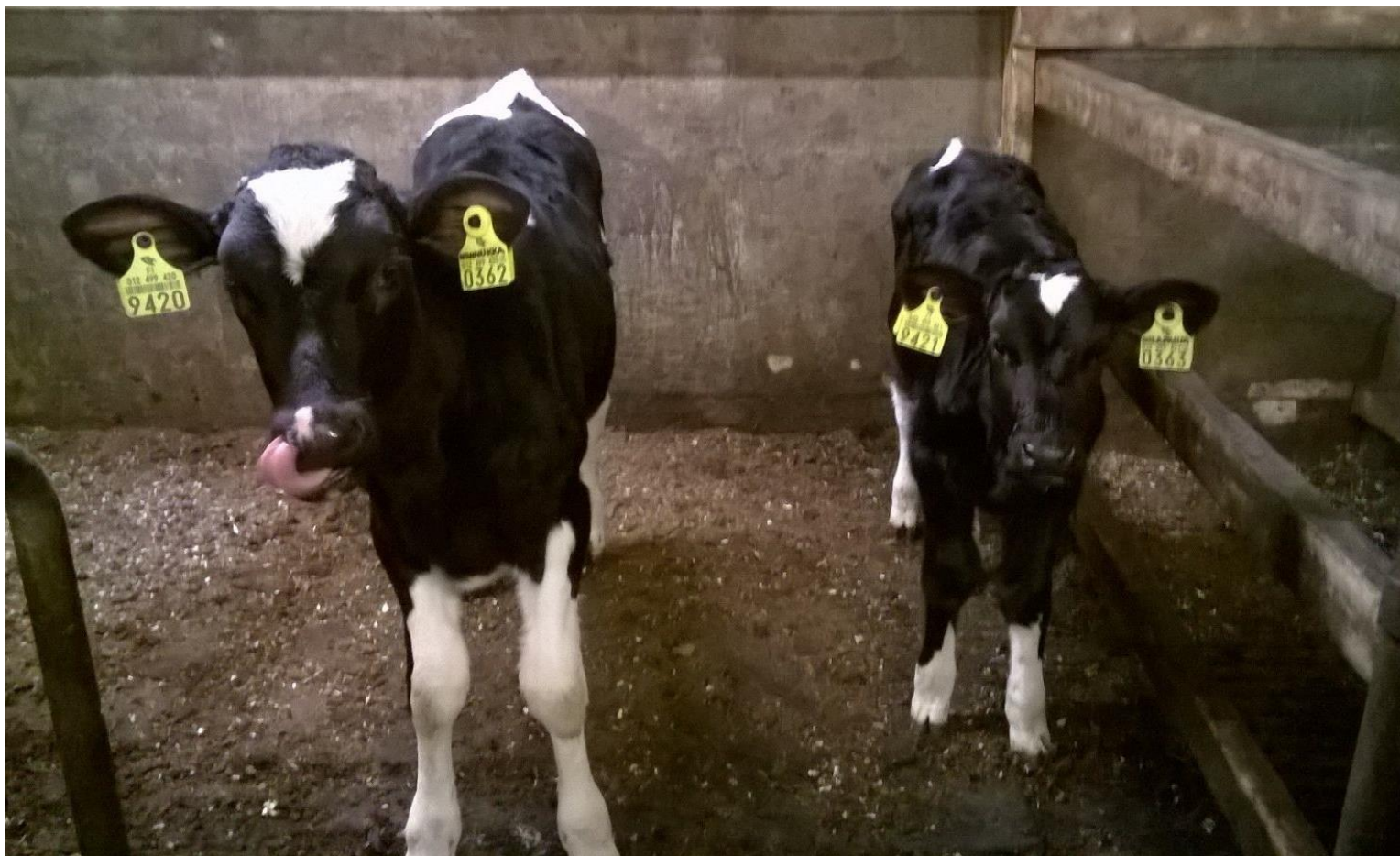
Kokoeroja on – näillä ikäero 2 vk.